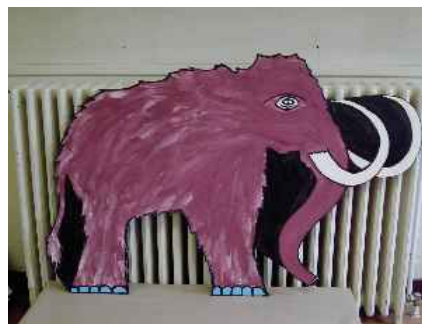
Un mamouth dans notre collège!