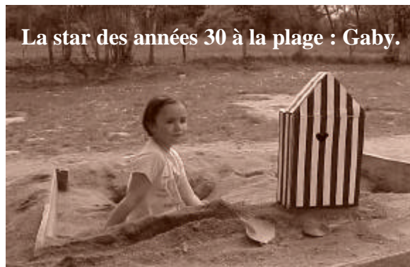
La star des années 30 à la plage : Gaby.