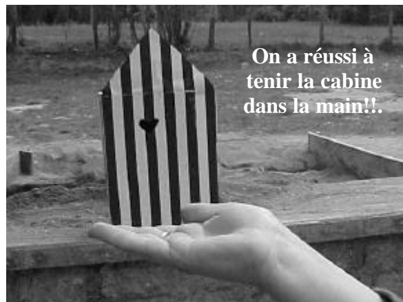
On a réussi à tenir la cabine dans la main!!.