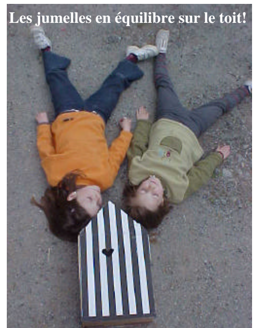
Les jumelles en équilibre sur le toit!