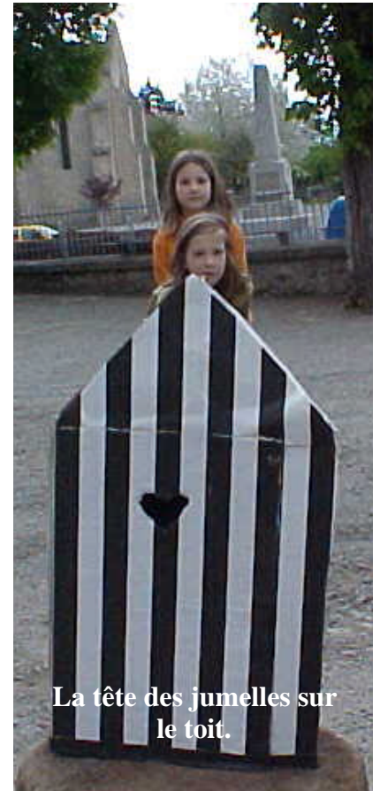
La tête des jumelles sur le toit.

Les autres photos sont réalisées de la même manière, en variant la place des sujets et celle du photographe.